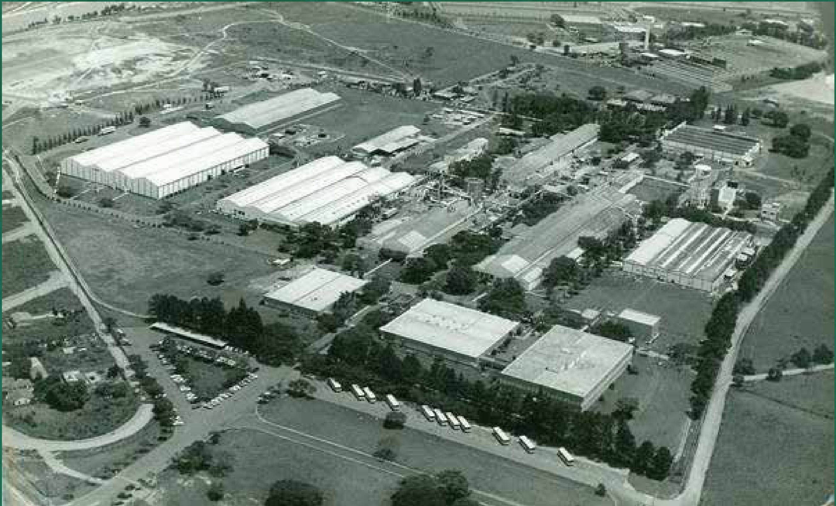
Foto aérea da 3M do Brasil, a primeira multinacional a se instalar em Sumaré, na década de 1940. Localizada às margens da Rodovia Anhanguera, ainda hoje é uma das empresas que mais contribuem para o município e na oferta de empregos. Mais acima, à direita, as instalações da antiga empresa B.F. Goodrich, que fabricava pneus.