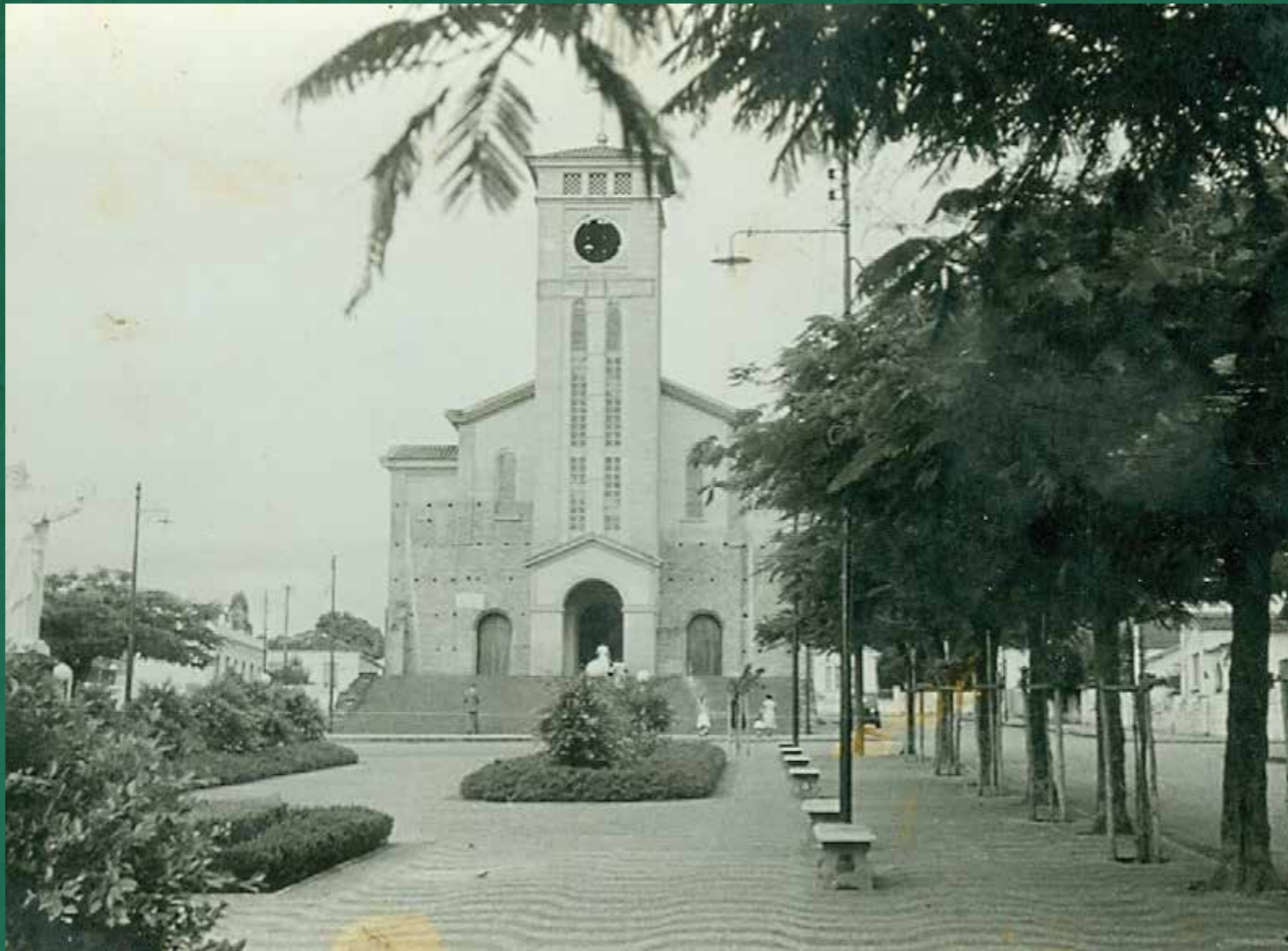
Imagem da década de 1950. A Paróquia de Sant'Ana foi inaugurada em 1914, mas localizava-se na quadra de baixo da igreja que conhecemos hoje. Ela foi demolida em função da construção da nova matriz, ocorrida alguns anos mais tarde, sob a supervisão do Padre José Giordano. A Matriz de Sant'Ana está em processo de estudo de tombamento municipal.